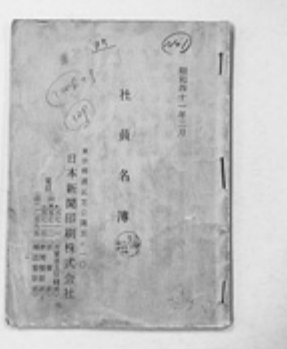
昭和41年の日本新聞印刷社員名簿